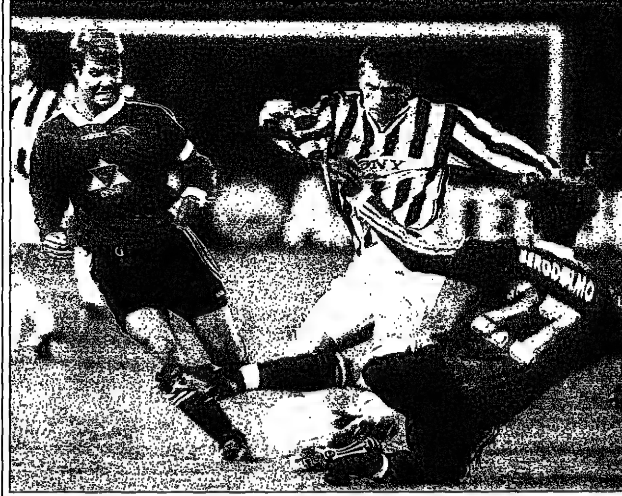
الاندلس جيو فينيتش لاعب يوفنتوس في الوسط في صراع على الكرة

من مدريد - ويذكر بريس الهولندي للشرق قبل النهائي لكأس أوروبا لكرة القدم بعد فوزه 3-2 على اياكس مدريد في مباراة العودة بدور النصف النهائي، وسعد اياكس بكرة في مجموع مباريات الذهاب والعودة 4-3. وفي المباراة سجل كوكو لاعب اياكس هدفه الثاني في الدقيقة 29 وانتقى الشوط الاول 1-صفر لصالح الفريق الهولندي، وتبادل روتاند دويوير لاعب اياكس في الدقيقة 49 لينتقى الوقت الاصلي للمباراة بالتعادل 1-1. وفي الوقت الإضافي سجل داني لايكس اياكس الهدف الثاني في الدقيقة 96 وتبادل ميلينكو بلاتيش في الدقيقة 105 من ضرورة جزاء غير ان تيباتي باياجيتيدا لاعب اياكس سجل هدف الفوز في الدقيقة 119. وحضر المباراة 54 الف متفرج، وفي تورينو يطاليا تامل يوفنتوس الايطالي للشرق قبل النهائي بفوزه 2-صفر على يوفنتوس في الشوط الثاني، وسعد يوفنتوس بكرة في مجموع مباريات الذهاب والعودة 3-3. وفي مباراة الاس اس سجل زين الدين زيدان الهدف الاول في الدقيقة 29 ولتقى الشوط الاول 1-صفر لصالح الفريق الايطالي ليُسجل ليكولا اموروزو الهدف الثاني في الدقيقة 90 من ضربة جزاء. وفي اوتريخ بروسيا سعد بروسيا دورتموند الألماني للشرق قبل النهائي بفوزه 3-صفر على اوتريخ الفرنسي في مباراة العودة بدور النصف النهائي، وتبادل بروموند وفق نتيجة مباريات الذهاب والعودة بالتعادل 4-4. وفي المباراة التي انقضى شوطها الاول بالتعادل السليبي سجل اريس ويكس هدف الفريق الألماني في الدقيقة 59 وحضر المباراة 21 الف متفرج. وفي برلين بروسيا سعد مانشستر يونايتد الانكليزي للشرق قبل النهائي لهذه البطولة للمرة الاولى في